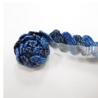
緩まないよう丸めていきます。