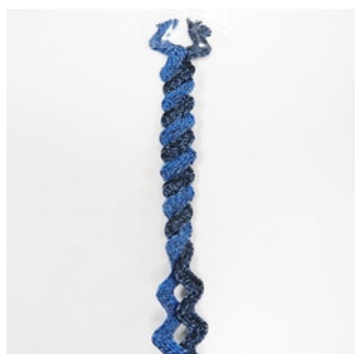
リボンを写真のように交互に 重ね、ストライプ状に20cm 編みます。