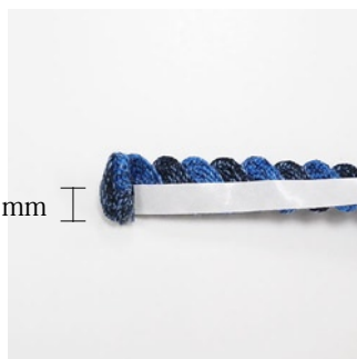
下半分（約5mm）に両面テープを 貼り、端のほつれを内側に巻き込む ように巻いていきます。