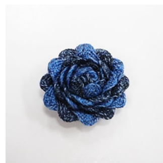
<完成 2> 周りのリボンを花びらの ように、外側へ折るように広げます。 最後に、金具に接着し完成です。