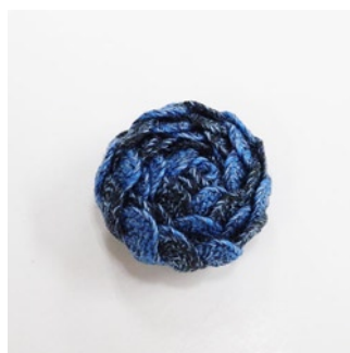
<完成 1> つぼみは、ここまでで完成です。 小さめのつぼみは、長さを短めに 調整してください。