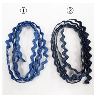
リックラックリボンを20cm 2本用意します。