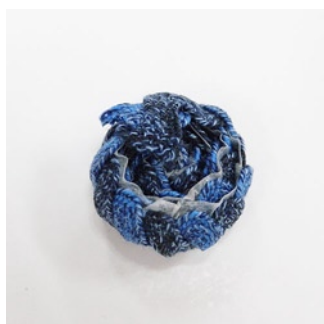
最後は、端を裏面に貼付けます。 （裏の写真）